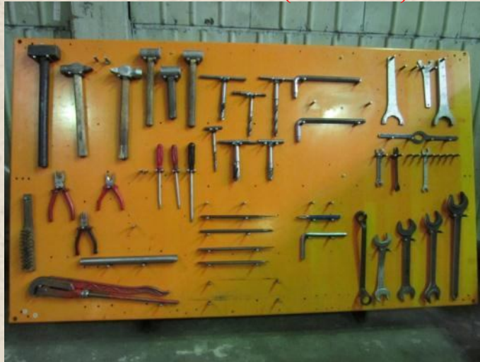
МВМ (418 цех)