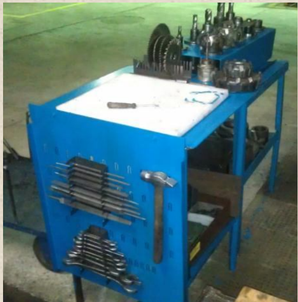
МВМ (418 цех)