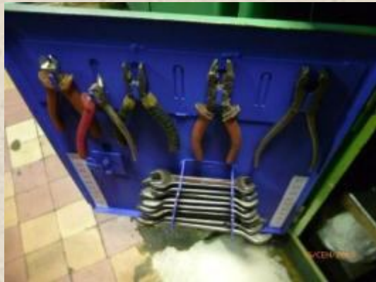
МВМ (35 цех)