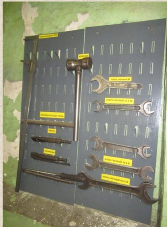
МВМ (16 цех)