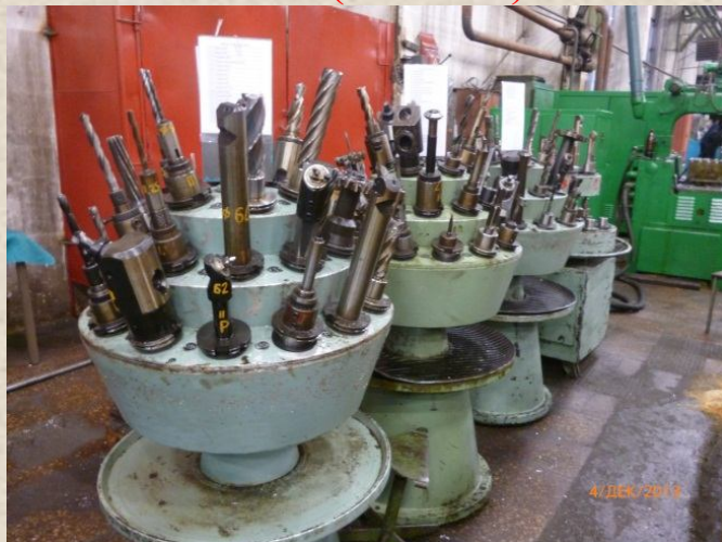
МВМ (418 цех)