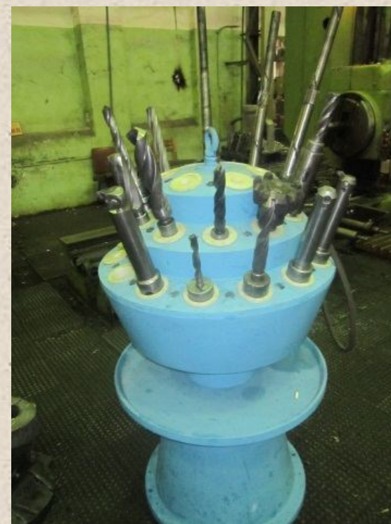
МВМ (16 цех)