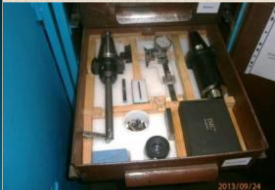
МВМ (418 цех)